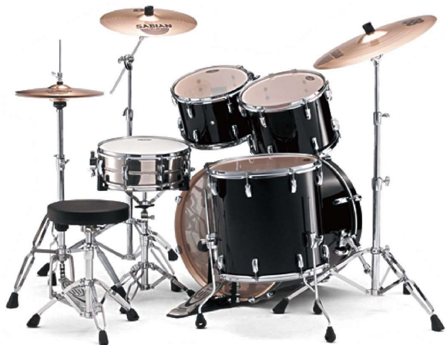
PEARL VISION VX SERIES (BIRCH)